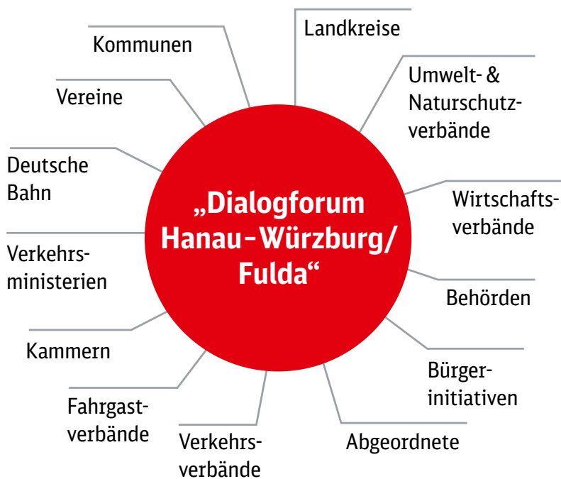
Am Dialogforum Hanau–Würzburg/Fulda sind alle betroffenen Personenkreise beteiligt.

Zusätzlich veranstaltet die Deutsche Bahn regelmäßig Bürgerinformationsveranstaltungen oder Bürgerwerkstätten, zu denen jeder Interessierte eingeladen ist. Mit diesen Formaten soll sichergestellt werden, dass jede Interessensgruppe sich einbringen kann – unabhängig davon, wie viel Zeit ihr zur Verfügung steht, ob ihr einzelne Planungsthemen wichtig sind oder sie den Prozess langfristig begleiten möchte.